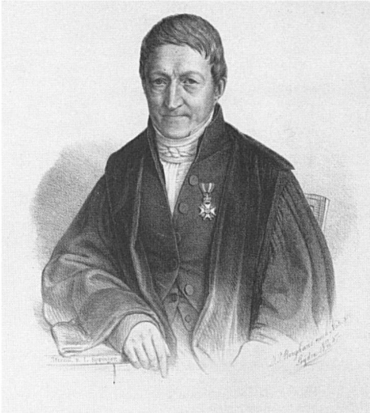
Matthijs Siegenbeek.